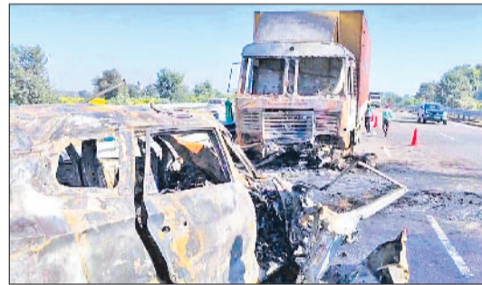
नारनौल। हादसे उपरांत घटनास्थल खड़ी कार एवं केंटर व हादसे में बुरी तरह क्षतिग्रस्त कार।

इस टक्कर में उनकी गाड़ी के एयरबैग खुल गए। हालांकि, ये इससे पहले कि गाड़ी से निकल पाते, कार ने तेजी से आग पकड़ ली। बताया जाता है कि कल बुधवार को दिन ही में