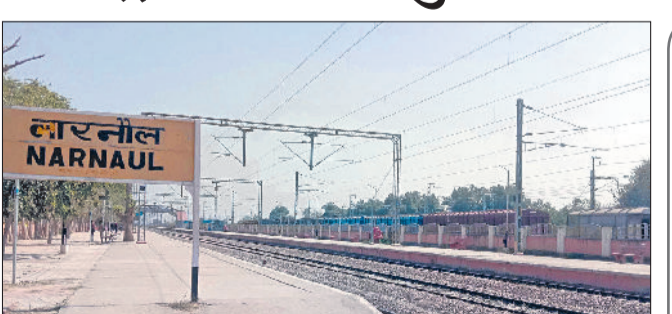
नारनौल। नारनौल रेलवे स्टेशन।