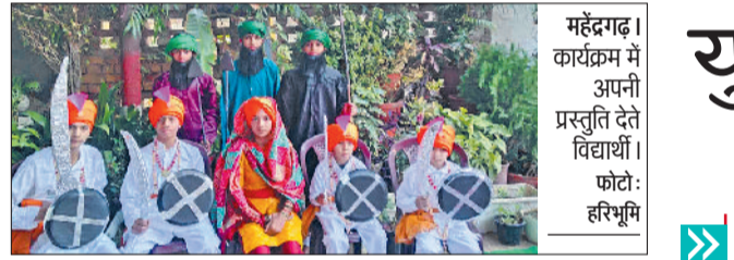
महेंद्रगढ़। कार्यक्रम में अपनी प्रस्तुति देते विद्यार्थी। फोटो: हरिभूमि