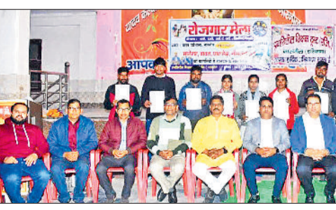
नारनौल। अभ्यर्थियों का साक्षात्कार लेते कम्पनी प्रतिनिधि तथा चयनित अभ्यर्थियों को ऑफर लेटर प्रदान करते ट्रस्टी व कंपनियों के पदाधिकारी।