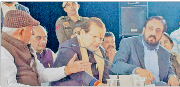
नारनौल। बैठक में मौजूद मंत्री डा. अरविंद शर्मा।

सहकारिता मंत्री डॉ. अरविंद कुमार शर्मा ने वीरवार जिला लोक संपर्क एवं जन परिवेदना समिति की मासिक बैठक में हरियाणा राज्य कृषि विपणन बोर्ड द्वारा जिला महेंद्रगढ़ में वर्ष 2025 के दौरान बनाई गई सभी सड़कों का ऑडिट करवाने के आदेश दिए। इस मामले में उम्मीद जन सहयोग फाउंडेशन महेंद्रगढ़ की तरफ से की गई शिकायत पर संज्ञान लेते हुए सहकारिता मंत्री ने हरियाणा राज्य कृषि विपणन बोर्ड द्वारा बनाई गई सभी सड़कों के सैंपल लेने के निर्देश दिए। उन्होंने कहा कि विकास