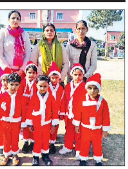
कनीना। सांता की वेशभूषा में विद्यार्थी।