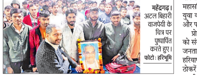
महेंद्रगढ़। अटल बिहारी वाजपेयी के चित्र पर पुष्पांजलि करते हुए।