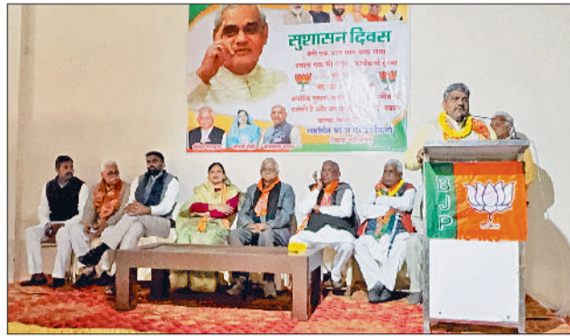
नारनौल। मंच पर मौजूद भाजपा नेता व मंच के सामने कुर्सियों पर बैठे भाजपा कार्यकर्ता।