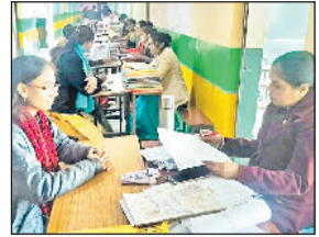
नारनौल। पीटीएम में भाग लेते अध्यापक अभिभावक।