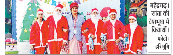
महेंद्रगढ़। सांता की वेशभूषा में विद्यार्थी।